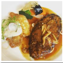
イチ押しのハンバーグ！

はセミナーの始まる前に社員みんなでのランチ！事務所の二軒東隣の「北欧館」さん、日替わりランチやカレーが美味しいですよ(^^)/