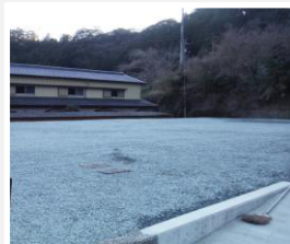
After 更地になりました

見積もり依頼や重くて自分では捨てにくい物の処理などのご相談をいただいたりしています。